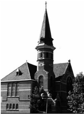
Noorderkerk, Amsterdamseweg 9 http://ede.protestantsekerk.net