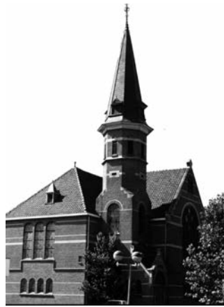
Noorderkerk, Amsterdamseweg 9 http://ede.protestantsekerk.net